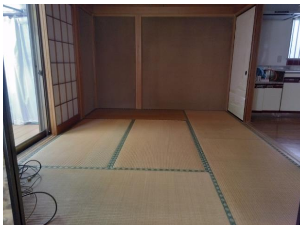
1階 和室 (部屋1)