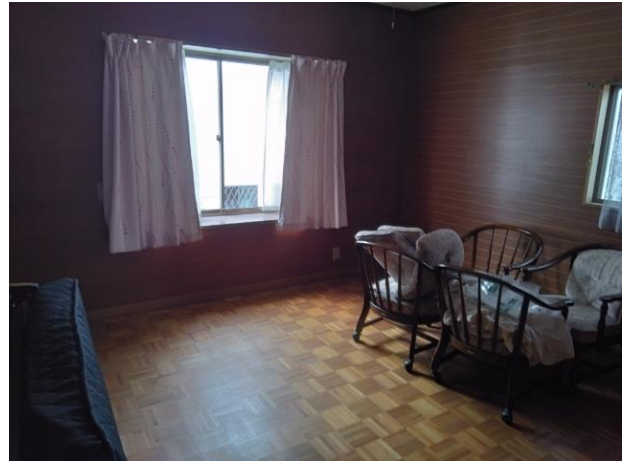
2階 洋室 (部屋4)