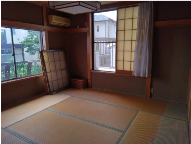
2階 和室 (部屋3)