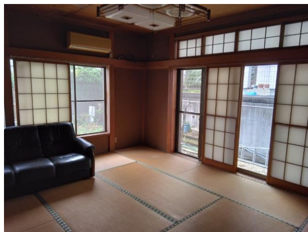
1階 和室 (部屋2)