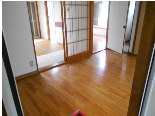
ダイニングキッチン (写真 1)