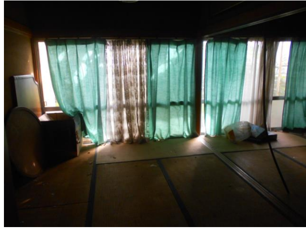
和室 2 (6畳)