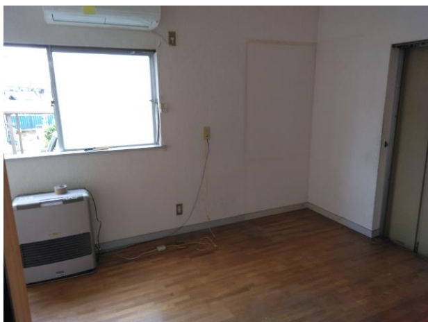
洋室 (部屋 3)