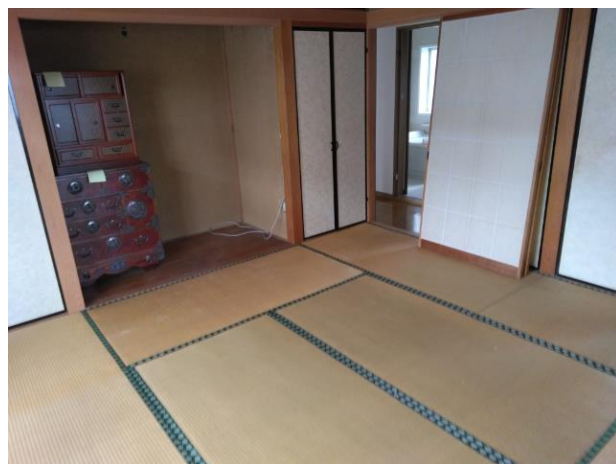
和室 (部屋 2)