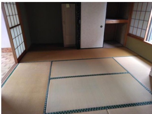
和室 (部屋 1)