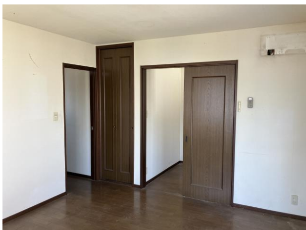
2階 洋室 (部屋2)