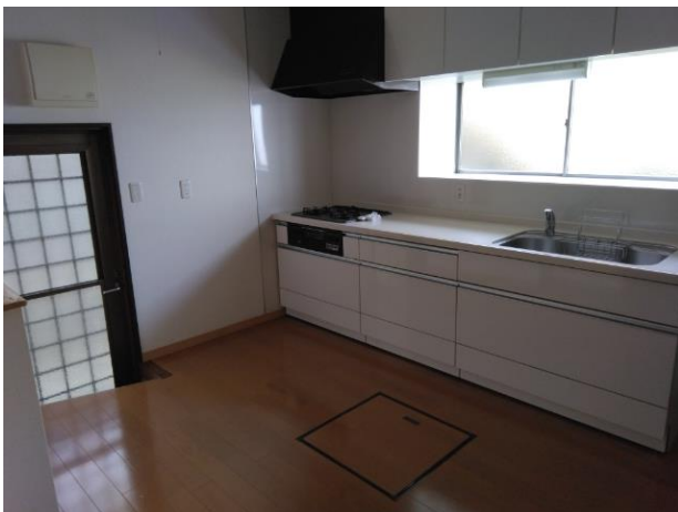
キ ッ チ ン