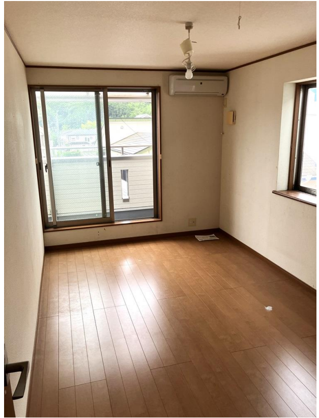
2階 洋室 (部屋2)