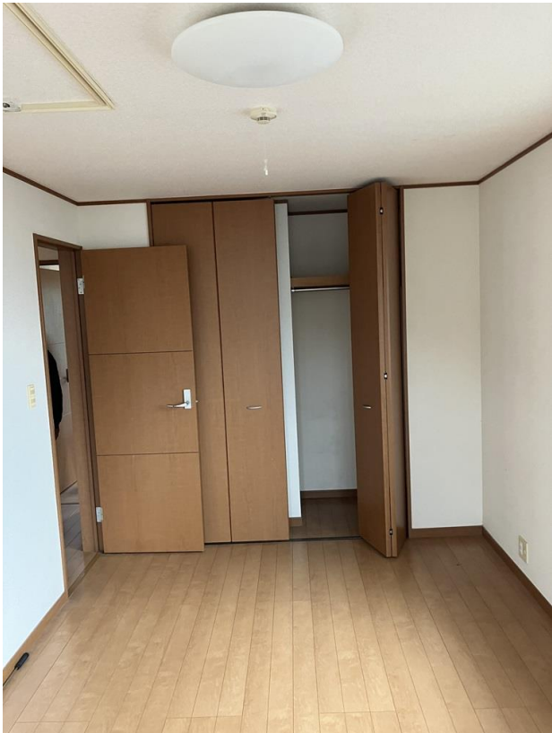
2階 洋室 (部屋3)