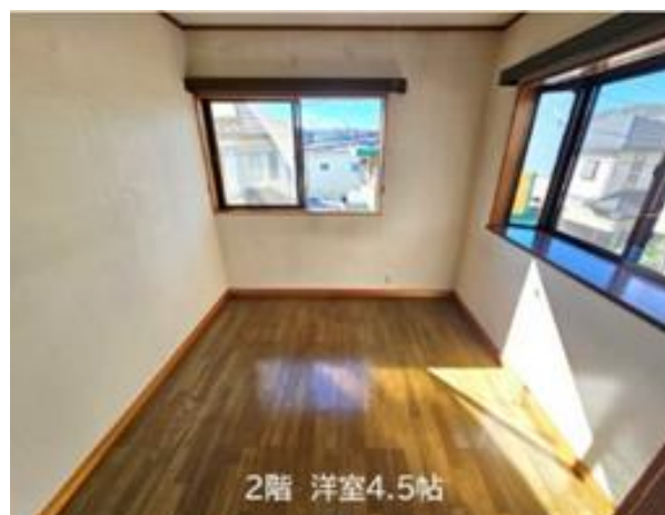
2階 洋室 (部屋2)