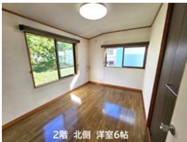
2階 洋室 (部屋1)