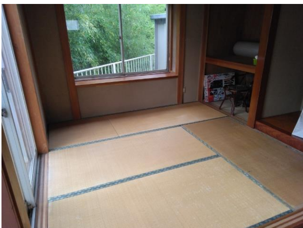
1階 和室 (部屋1)