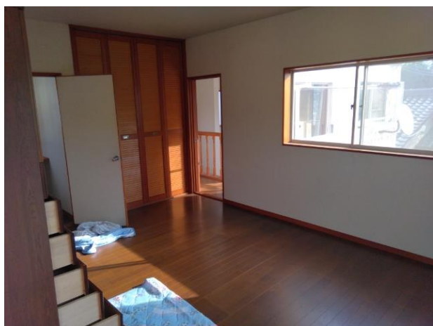
2階 洋室 (部屋2)